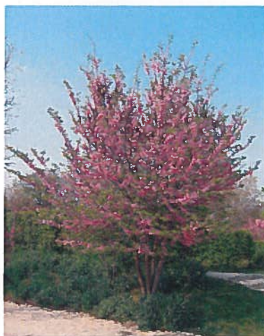
Arbre de judée

Sur la partie jouxtant le terrain de pétanque, il est prévu une zone verte agrémentée de quelques cépées, soit des arbres de petites dimensions, décoratifs et atteignant une hauteur maximale de 5 à 6 m, tels que l'arbre de judée et l'amélanchier du canada.