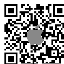
Lien App Store