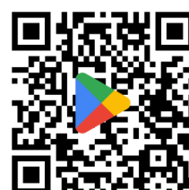
Lien Google Play

Cette application installée, il vous suffira ensuite de créer votre compte et de choisir Founex en tant que Commune pour laquelle vous concurrez. A partir de ce moment-là, vous pourrez enregistrer toutes vos minutes d'activité pour le compte de la collectivité.