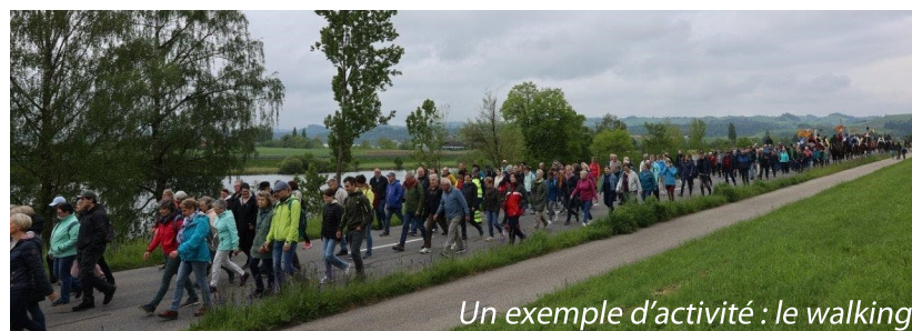
Un exemple d'activité : le walking

Le 10 mai 2025 sera la journée phare de Founex.Bouge, durant laquelle seront prévues différentes activités, pouvant consister en une randonnée pédestre, en des jeux d'équipes, ou en des cours de gymnastique. Elles auront lieu sur le parking de l'auberge communale, ainsi que sur la place de jeux attenante. Nous ne manquerons pas de vous informer de cette journée plus en détails au fur et à mesure de son organisation, que ce soit par le biais du site internet communal, ou via un prochain tous-ménages.