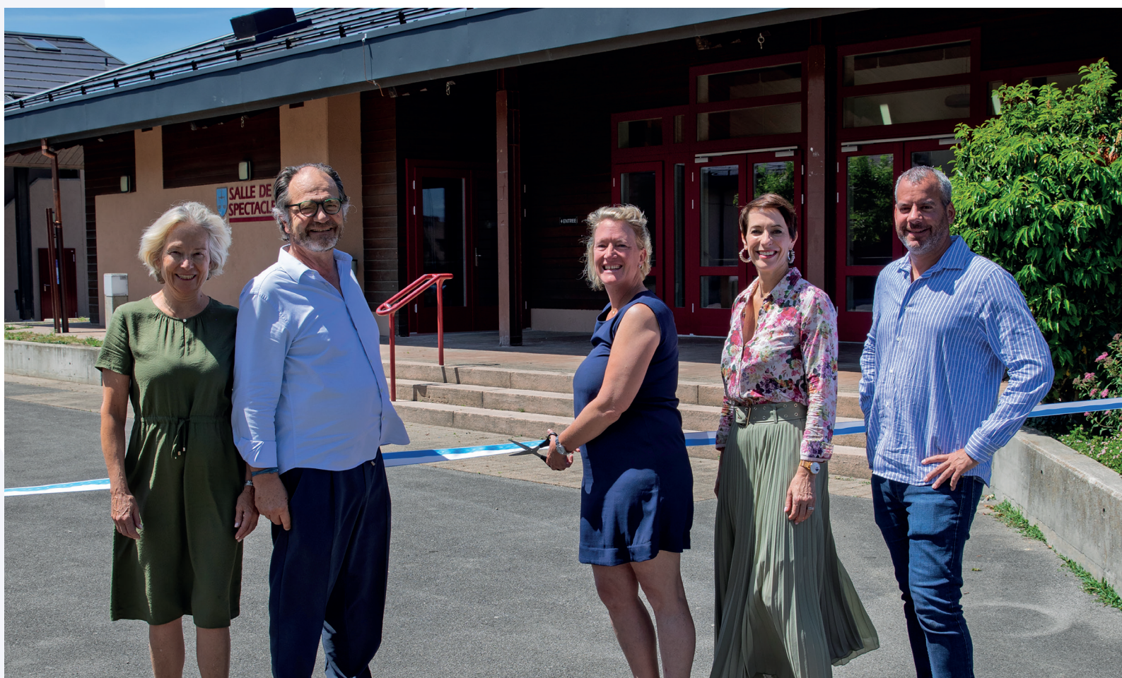
La municipalité inaugure le nouvel équipement photovoltaïque du centre communal.

par la Commune: moderniser ses bâtiments, réduire son empreinte énergétique et investir durablement dans les énergies renouvelables. ■