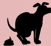
Crottes de chien

Plantes nuisibles et/ou envahissantes Plantes-hôtes du feu bactérien (ambrosie, renouée du Japon, etc.)