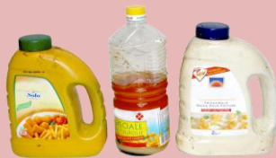
Huile ou graisse végétale usagée