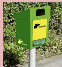
POUBELLES « BRAVO »

* : Le personnel de la déchetterie est disposé à vous renseigner