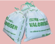
SACS POUBELLE TAXÉS